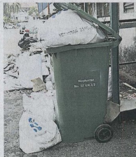
▲商家受促自备垃圾桶装垃圾，不能把垃圾乱丢路边。