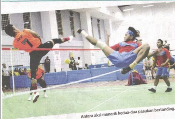
Antara aksi menarik kedua-dua pasukan bertanding.

Provided for client's internal research purposes only. May not be further copied, distributed, sold or published in any form without the prior consent of the copyright owner.