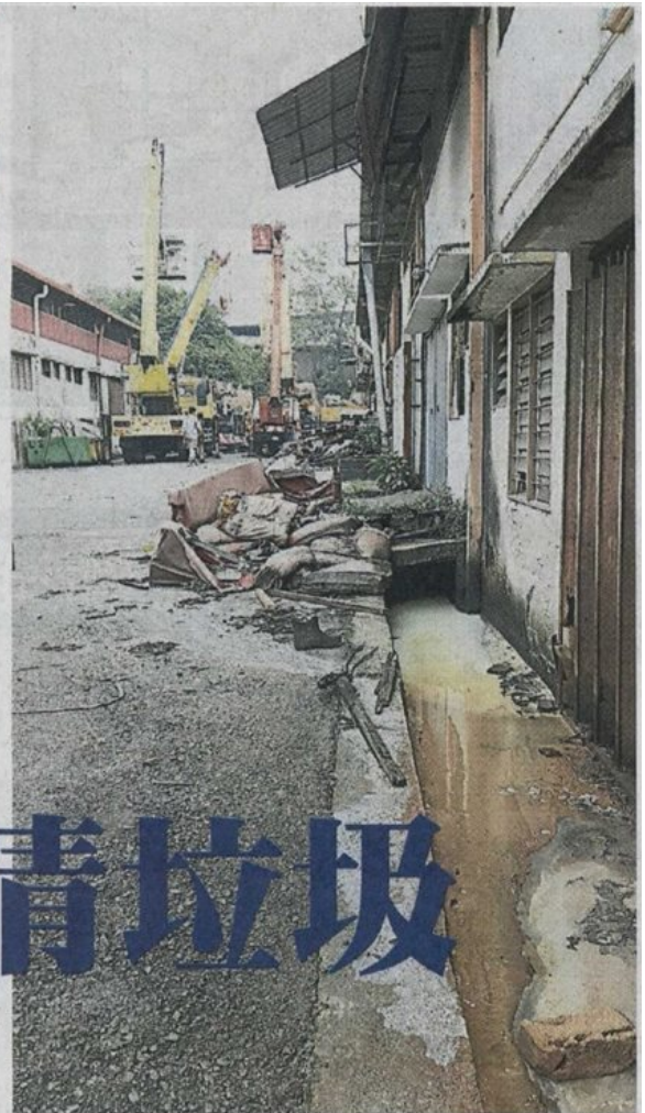
▲除了垃圾乱丢、重型车辆霸占问题严重，也有一些厂家排放污水到沟渠里。