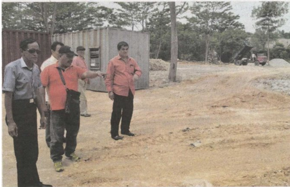
Penduduk menunjukkan tapak sekolah Kafa yang ditambah sebuah syarikat untuk dijadikan pejabat tapak dan stor simpanan barang.