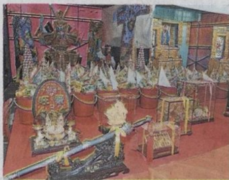
■大会准备9件福品，让出席的商民投标。