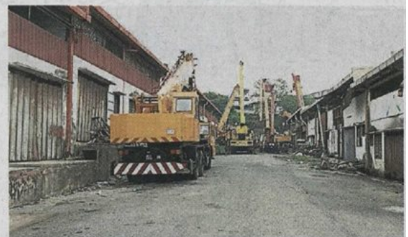
▲其中一条道路被多辆重型吊车霸占路面，变成私家停车场。

“厂商把垃圾乱丢路边，那是属于非法垃圾，承包商是不会去处理，如果要解决垃圾问题，厂商要自备垃圾桶。”