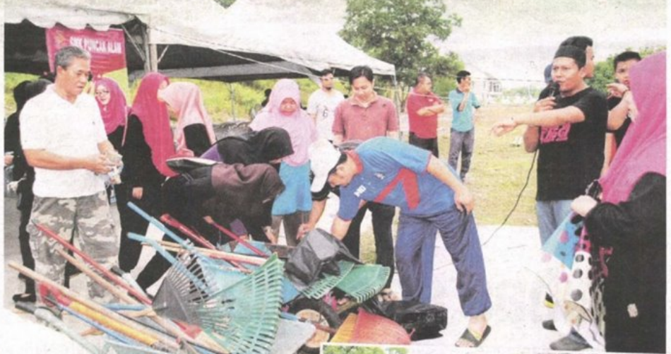
Sebahagian penduduk bersedia dengan peralatan masing-masing untuk memulakan aktiviti gotong-royong.

Program gotong-royong buat kali ke-15 itu turut menyaksikan penglibatan hampir 200 penduduk setempat bersama pelajar dan guru SMK Puncak Alam di kawasan sekitar Alam Suria 5A3.