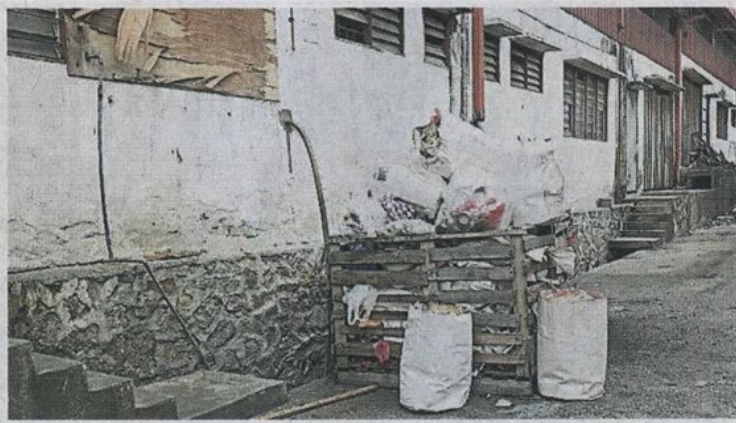
▲一些商家自制垃圾架装垃圾，但垃圾没有处理，越堆越多。