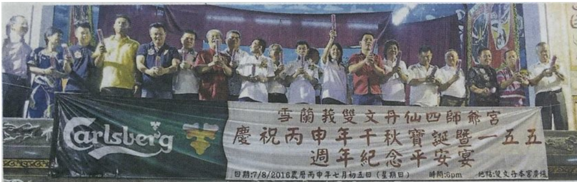
■ 热心善信主持剪彩仪式。

Provided for client's internal research purposes only. May not be further copied, distributed, sold or published in any form without the prior consent of the copyright owner.