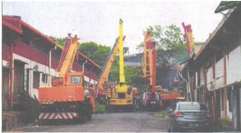
Factory operators at the Taman Selesa Jaya industrial area in Balakong are placing their goods, vehicles and rubbish along the roadside, causing inconvenience.