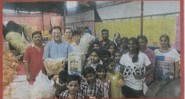
▲安邦美华城工业工商会及安邦丽华镇孟兰胜会移交物资给受惠者后合照。