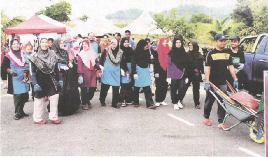
Sebahagian penduduk dan pelajar SMK Puncak Alam berganding bahu menjayakan aktiviti gotong-royong.