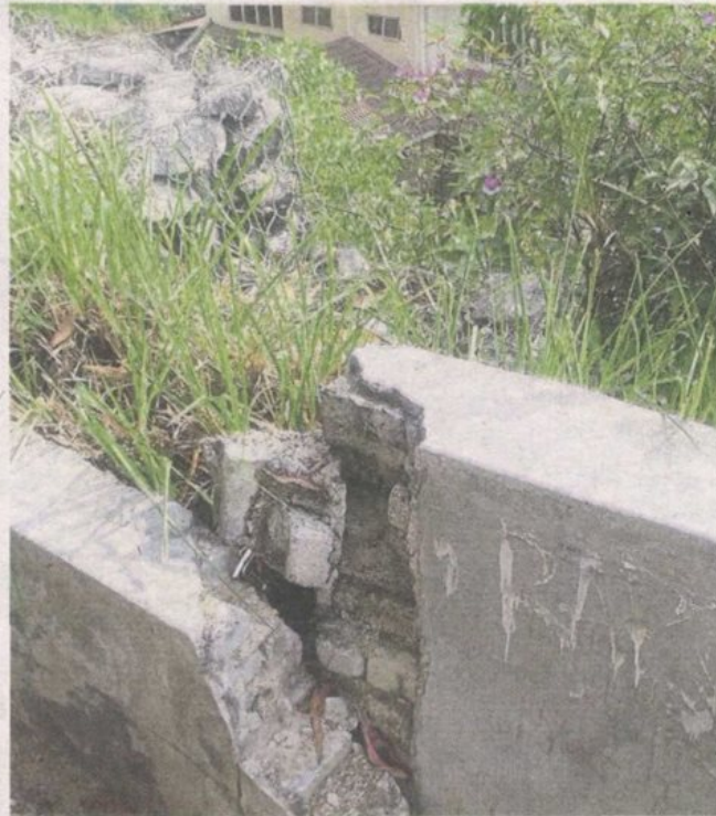
Rainwater flows through the collapsed drain down to the houses along Jalan RP11/8.