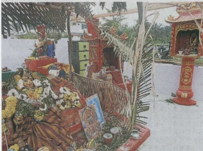
■庙主逼于无奈,自行拆除兴都庙顶:现场可见兴都神和华人拿督公共患难见真情。