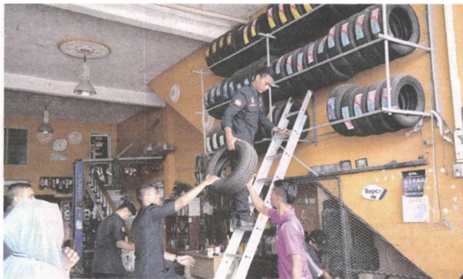
Penguat kuasa menyita tayar sebuah bengkel selepas pemiliknya mengendahkan waran dan mengumpul tunggakan kira-kira RM20,000.