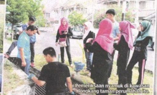
Pemeriksaan nyamuk di kawasan longkang taman perumahan itu.