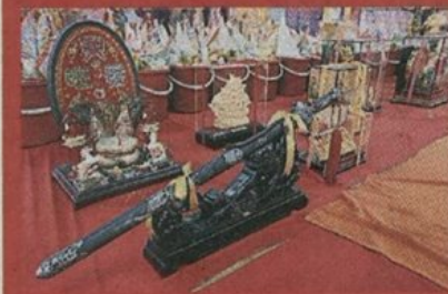
▲安邦美华城工业工商会及安邦丽华镇2016年度第11届孟兰胜会准备了8份福品供善信竞标。